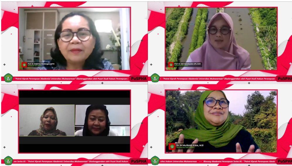
Foto 3: Narasumber Webinar Kiprah Perempuan Akademisi di Universitas Mulawarman