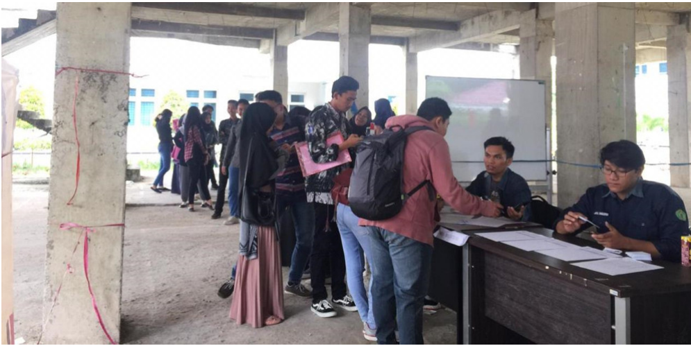
Foto 1: Sejumlah mahasiswa melakukan verifikasi data sebelum ikut melakukan pemilihan suara PEMIRA FH UNMUL 2019