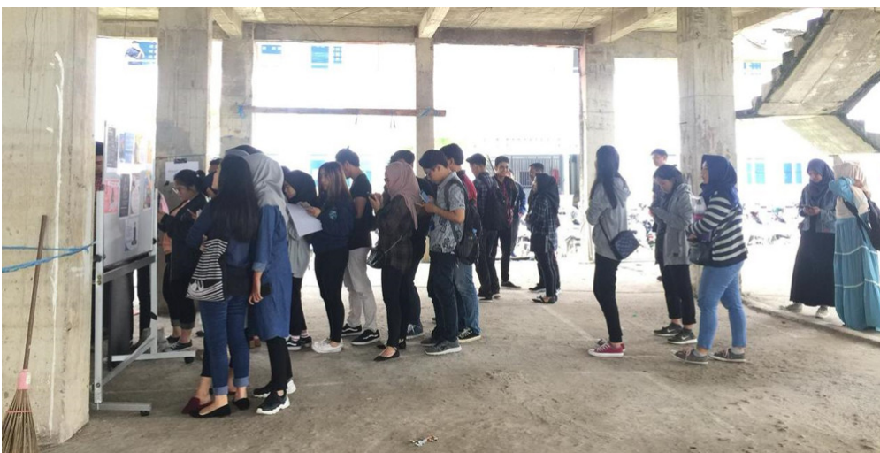
Foto 3: Antusias mahasiswa mengikuti Pemira DPM FH UNMUL 2019 dapat terlihat dari antrian di TPS.